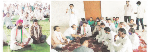
पटेल का पत्र है, जिसे वित्तनामा हमारा फर्ज है। बैठक को संबोधित करते हुए छिंदवाड़ा से आये भाई...